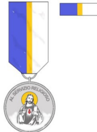
AL SERVIZIO RELIGIOSO