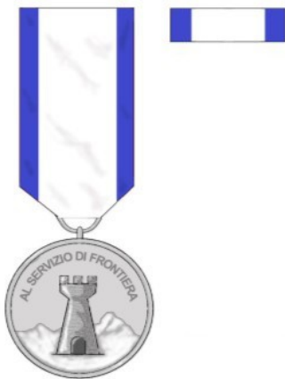
AL SERVIZIO DI FRONTIERA