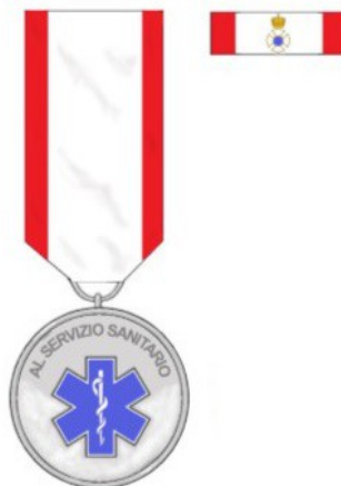
AL SERVIZIO SANITARIO